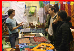
Des échanges pour s'informer et comprendre pour mieux agir