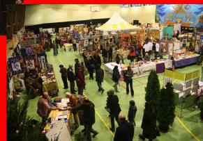
Un marché pour consommer juste, et ne pas juste consommer !